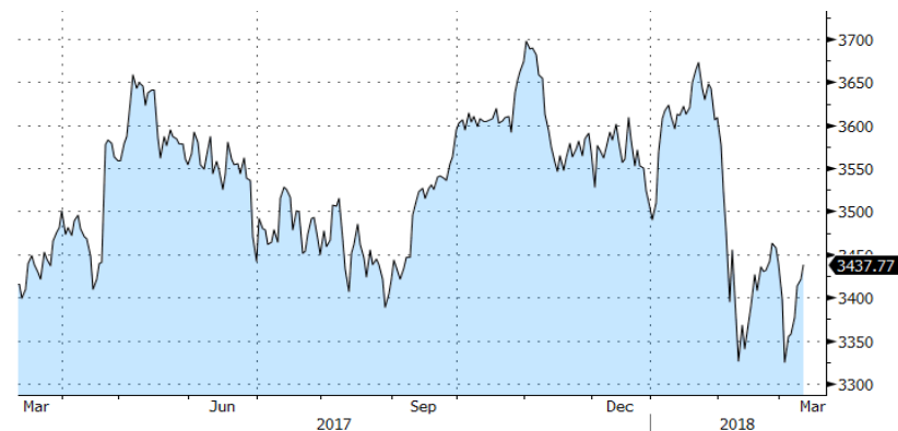
EURO STOXX 50 - 1 Y

Referente al mercado de deuda, el bono alemán a diez años reaccionó con repuntes tras el discurso hawkish de Draghi para luego posteriormente volver a estabilizarse en niveles de 0,65%. Por su parte, la deuda italiana reaccionó inicialmente de forma negativa a los resultados de las elecciones. En contrapartida, destacamos el buen comportamiento de la deuda española y portuguesa, cuyos spreads estrecharon significativamente.